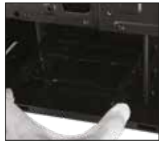
3- Sabit diskin titreşimini önlemek için braketini kasa gövdesine vidalayın.