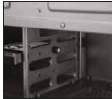
Sabit diskin titreşimini önlemek için braketini yukarıdaki resimde gösterildiği gibi kasa gövdesine vidalayın.