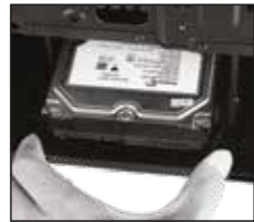
2- Depolama ekipmanı 3,5 Plastik braketine yerleştirin.