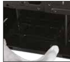
İlk başta plastik braketlerin resmi gibi Sabit sürücü bölmesinden çıkarın.