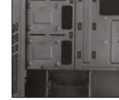
1- 2,5 inç sabit sürücülerin kurulum yeri