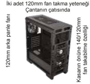
İki adet 120mm fan takma yeteneği Çantanın çatısında