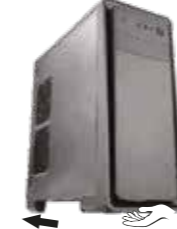
Kasa panelini alttan tutun ve dışarı doğru çekin.