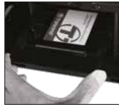
Depolama ekipmanı 2,5 x 4 numara Plastik braketin altına vidalayın.