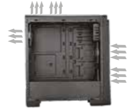
Gelen ve giden hava akışının doğru yönü