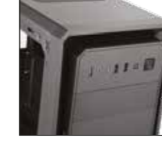
3- Kasanın ön panelindeki USB300 bağlantı noktalarının konumu