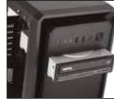
2- Optik sürücüyü yukarıdaki resimde gösterildiği gibi belirtilen bölmeye yerleştirin.