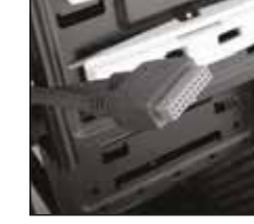
1 - 20 pinli USB300 konektörünün resmi