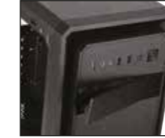
Öncelikle optik sürücü kapağının klipsini dışarı doğru çekin ve çıkarın.