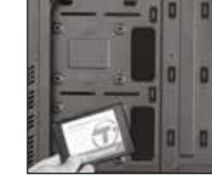
2- İsteddiğiniz sürücüyü yukarıdaki resimde gösterildiği gibi ilgili yere koyun.