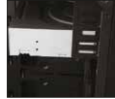
3- Kasa gövdesinin her iki yanına vidalarla sıkıca sabitleyin.