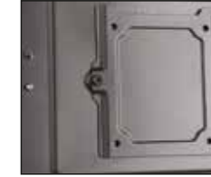
1- Anakart tepsisinin arkasında 2,5 metal braket