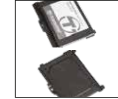
2- Vidayla yerine sabitlenen metal braketini 2,5 açın.