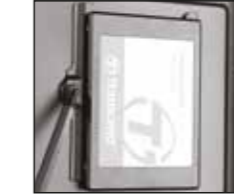
3- 2,5 sürücüyü kurduktan sonra braketini yerine yerleştirin. Yerine koyun ve kasa tepsisine vidalayın.