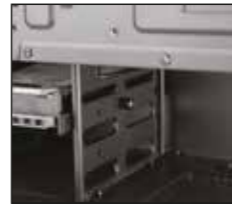
1- Sabit disk bölmesindeki plastik braketleri resimde gösterildiği gibi çıkarın.