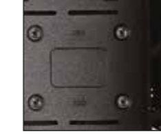
3- Sürücüyü 4 adet özel vidayla istenilen konuma bağlayın.