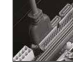
2- 20 pinli sokete USB300 konektörü anakarttaki USB'yi bağlayın.